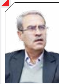
معاون اداری و مالی دانشگاه آزاد اسلامی: