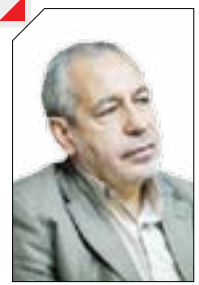
سناریوی استیضاح برای فانی تکرار می شود